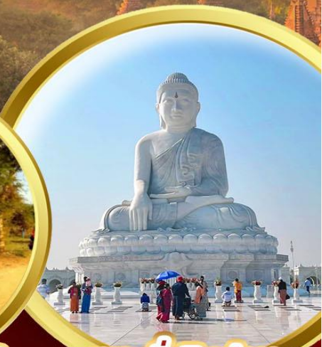
พระนั่งหินอ่อน