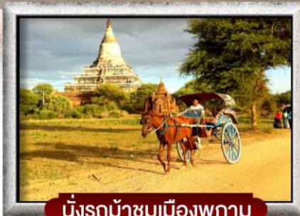
นั่งรถม้าชมเมืองพุกาม