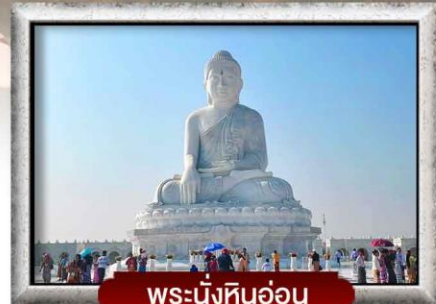
พระนั่งหินอ่อน