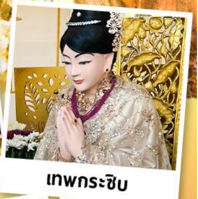
เทพกระซิบ