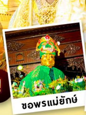
ขอพรแม่ยักย์