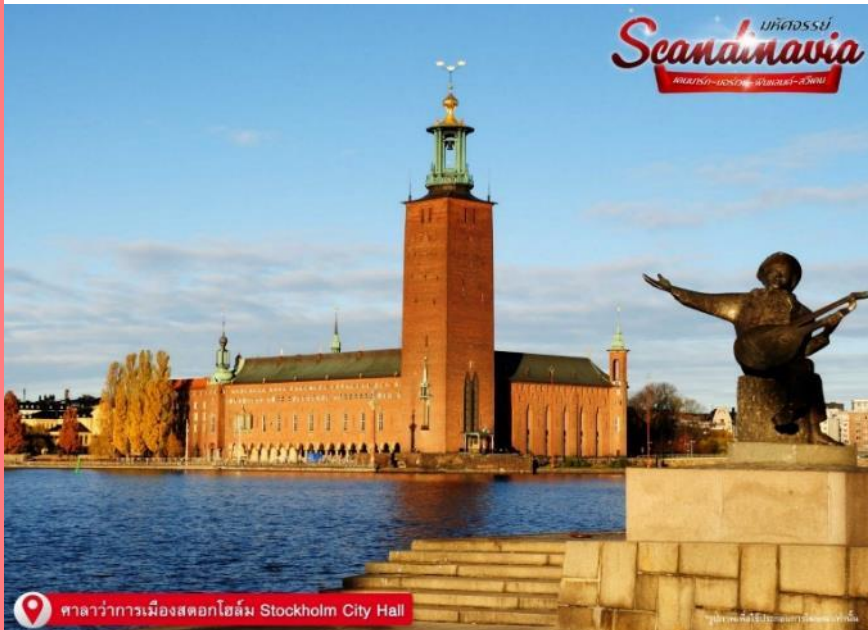
ศาลาว่าการเมืองสต็อกโฮล์ม Stockholm City Hall

09.30 น. เดินทางถึงท่าเรือ ณ กรุงสต็อกโฮล์ม (Stockholm) ประเทศสวีเดน นำท่านชม ศาลาว่าการเมืองสต็อกโฮล์ม (Stockholm City Hall) ศาลาว่าการ เมืองสต็อกโฮล์ม ใช้เวลาสร้างถึง 12 ปี