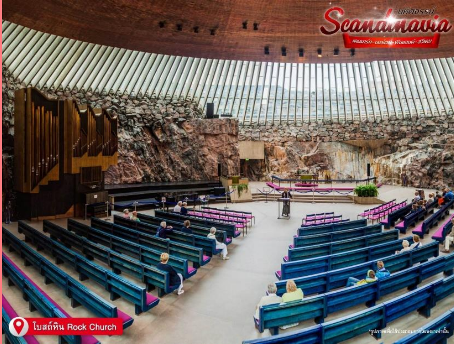
📍 โบสถ์หิน Rock Church

โบสถ์เทมเปลิโอคิโอ หรือ โบสถ์หิน (Rock Church) เป็นโบสถ์ที่มีสถาปัตยกรรมแปลกกว่าที่อื่น โดยแต่เดิมพื้นที่ของโบสถ์นี้เป็นเนินเขา และผู้ออกแบบได้ใช้วิธีสร้างโบสถ์ที่น่าสนใจ คือระเบิดเนินหินตรงกลางเพื่อสร้างโบสถ์ในนั้น โบสถ์ที่ได้ขึ้นชื่อว่าเป็นโบสถ์แห่งความรัก และมีความเชื่อว่าเมื่อใครก็ตามจุดเทียนอธิษฐานเรื่องเกี่ยวกับความรักในโบสถ์นี้แล้วจะสมหวังในสิ่งที่อธิษฐาน คนฟินแลนด์มีความเชื่อเรื่องนี้ เนื่องจากโบสถ์นี้สร้างขึ้นเมื่อวันที่ 14 กุมภาพันธ์ 2511 และเสร็จเมื่อวันที่ 14 กุมภาพันธ์ของปีถัดไป เดินทางสู่ จัตุรัสเซเนท (Senate