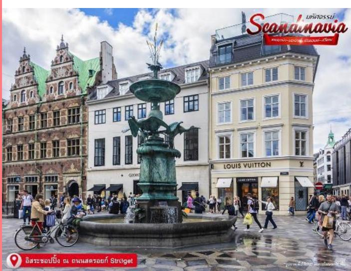
อิสระช้อปปิ้ง ถนนสตรีทอ์ก Strøget

ให้ท่านได้ อิสระช้อปปิ้ง ถนนสตรีทอ์ก (Strøget) ถนนคนเดินที่ยาวที่สุดในโลก ร้านบนถนนช้อปปิ้งสายหลักของเมืองนั้นเต็มไปด้วยแบรนด์ดังที่เราคุ้นเคยดี ตั้งแต่ Louis Vuitton ไปจน Urban Outfitter และ Zara ที่ไม่ว่าใครจะเข้ามาแล้วก็เมืองก็สาขาก็ไม่สามารถหยุดขาตัวเองไม่ให้เดินเข้าไปซ้ำได้ แต่ที่น่าสนใจมากกว่าคือร้านของแบรนด์ดีไซเนอร์ท้องถิ่นชื่อดัง อย่าง Wood Wood, Stine Goya, Henrik Vibskov ที่ตั้งอยู่บริเวณนี้เช่นกัน