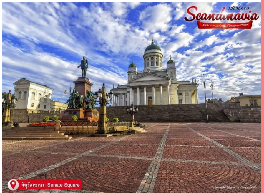
📍 จัตุรัสเซเนท Senate Square

Square) ถ่ายภาพอาคารที่น่าตื่นตาตื่นใจรอบๆ จัตุรัสขนาดใหญ่แห่งนี้ ซึ่งเป็นศูนย์กลางวัฒนธรรมของเมือง ศาสนาและวิทยาศาสตร์ในเมืองนี้ จัตุรัสขนาดใหญ่เป็นการอุทิศให้การออกแบบสไตล์นีโอคลาสสิกสมัยศตวรรษที่ 19 ด้านหน้าโบสถ์มีรูปปั้นพระเจ้าอเล็กซานเดอร์ที่ 2 ที่บริเวณนั้น หอสมุดแห่งชาติเฮลซิงกิ (Helsinki Central library) หน้าอาคารภายนอกสีเหลือง เสาสีขาวและโถงกลมตรงกลาง ในมุมมองวันออกเฉียงใต้ของจัตุรัสคือบ้านของเซเดร์โฮล์ม ซึ่งเป็นอาคารหินที่เก่าแก่ที่สุดของเมือง