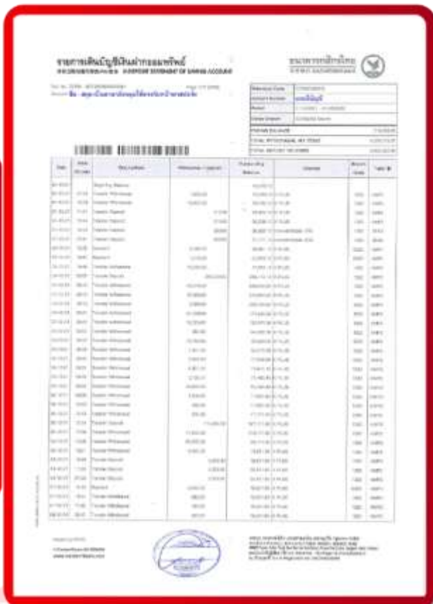
ตัวอย่าง Bank Statement ที่ผู้สมัครต้องขอธนาคาร

3.4 ปรับสมุดบัญชีธนาคารตัวจริง และเตรียมไปในวันที่ยื่นวีซ่า