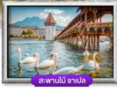
สะพานไม้ ซาเปลา