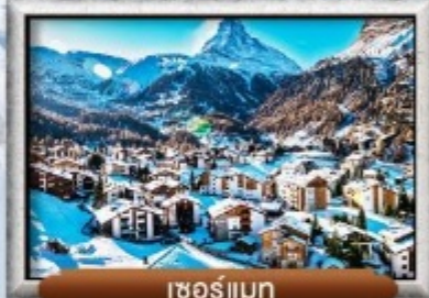
เซอร์แมน

บินหรู สายการบิน Full Service | พิเศษ! ลิ้มลองฟองดู 3 ชนิด