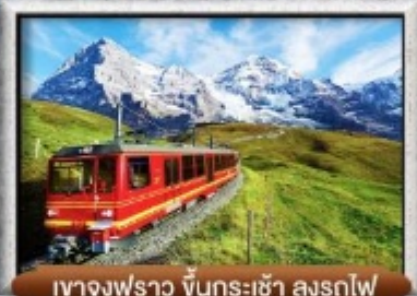
เขาจุงฟราว ขึ้นกระเช้า ลงรถไฟ