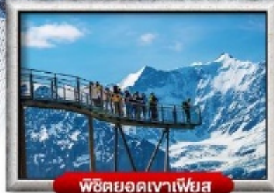
พิชิตยอดเขาเพียส