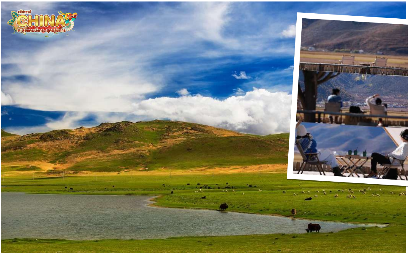
หมายเหตุ: ทิวทัศน์ขึ้นอยู่กับฤดูกาลและสภาพอากาศ

จากนั้น นำท่านชมความสวยงามของ ทุ่งหญ้านาผาไท อยู่สูงจากระดับน้ำทะเลกว่า 3,000 เมตร เป็นทะเลสาบที่ราบสูงตามฤดูกาล บางครั้งก็เป็นทะเลสาบพื้นที่ชุ่มน้ำที่ราบสูง บางครั้งก็เป็นทุ่งหญ้าอัลไพน์ Guiqing Grassland มีทั้งฝูงม้า ฝูงจามรี ทะเลสาบ และทุ่งหญ้าสีเขียวขจีรวมอยู่ในที่เดียว วิวข้างหลังเป็นภูเขาโอบล้อมทะเลสาบ นอกจากนี้ ยังสามารถเช่าชุดพื้นเมืองทิเบตมาใส่ถ่ายรูปที่นี่ได้อีกด้วย และแวะถ่ายรูปเซตอินซิมกาแพที่คาเฟ่ BLACK BEAN COFFEE HOUSE (ไม่รวมค่าเครื่องดื่ม)