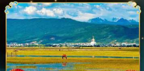
ทุ่งหญ้านาพาไห้