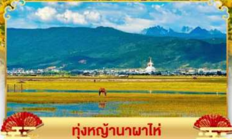
ทุ่งหญ้านาพาไห่