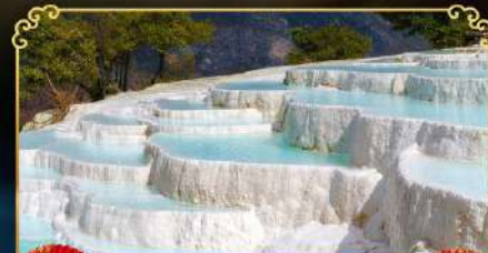
ระเบียงธารน้ำขาว